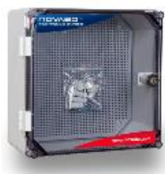
1. Skrzynka IP65