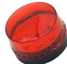
4. Syrena akustyka+LED