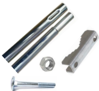
2. Zestaw montażowy